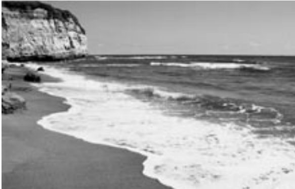
ドン・ロドリゴ一行が救出された田尻海岸