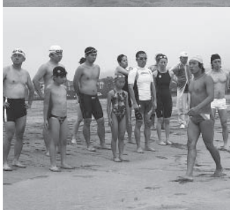
▶海の遠泳方法についての実技教室