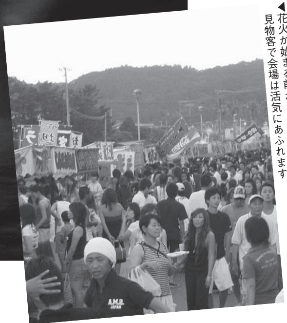
◀花火が始まる前から、立ち並んだ屋台と詰めかけた見物客で会場は活気にあふれます

たくさんの方の協力により、今年も花火大会が開催されます。御宿の花火大会は、近隣でも特に注目され、毎年、大勢の人で賑います。海岸ならではの水中花火や花火師のユーモア溢れる創作花火なども随所で予定されていて、見所いっぱいです。夏の夜を彩る鮮やかな花火を是非ご覧ください。