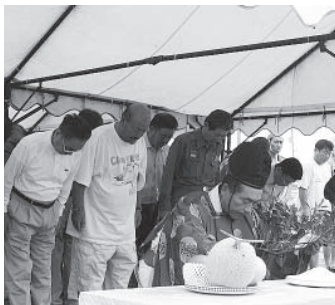
▶安全を祈願した修祓式

訪れた方皆さんが楽しい思い出を心に刻み、御宿町として素晴らしい夏にするために皆さんのご協力をお願いします。