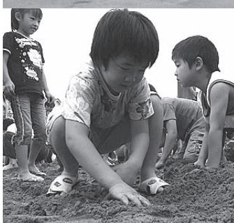
▶夢中で砂を掘り返し、砂に埋もれた宝の封筒を探しました