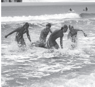
▶彼らが海の安全を見守ります