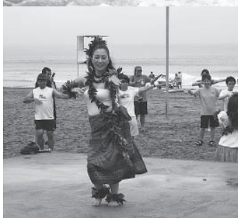
▶フラダンスの要素を取り入れた優雅なフラフィットネス