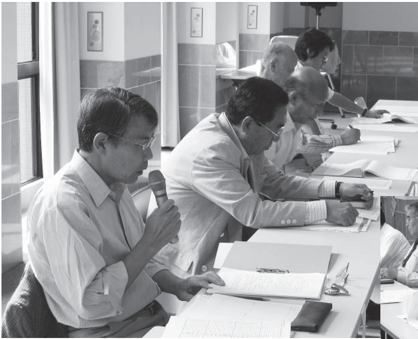
◀▼活発な意見が交わされた6月28日の第1回実行委員会