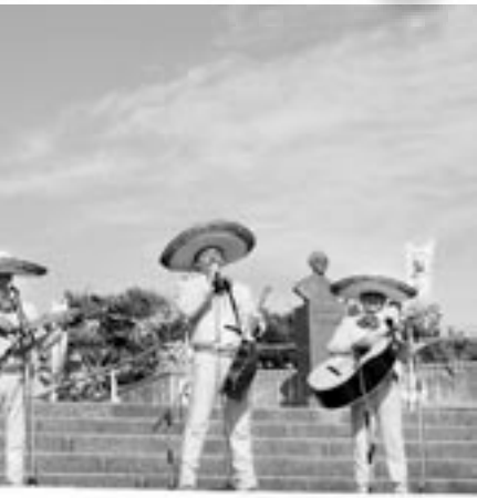
メキシコのマリアッチ