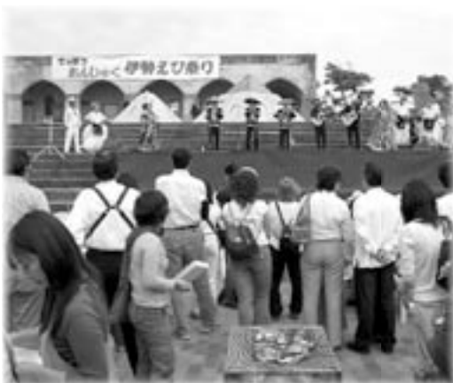
3国の交流を盛り込んだ伊勢えび祭り

平成16年度から継続実施している岩和田漁港整備や平成21年度に向けて中山間整備事業の計画を策定し、町基幹産業の基盤整備の充実を図りました。 観光においては海水浴場やウォーターパーク等観光施設の安全確保を維持した他、1年を通して町の魅力を多くの方々に伝えられるよう「海の花祭り」や「つるし雛めぐり」など様々なイベントを行いました。また、例年好評をいただいている「伊勢えび祭り」では、御宿・スペイン・メキシコの郷土芸能の披露や食の交流を行い、観光をとおし御宿の歴史を多くの方々に伝えました。