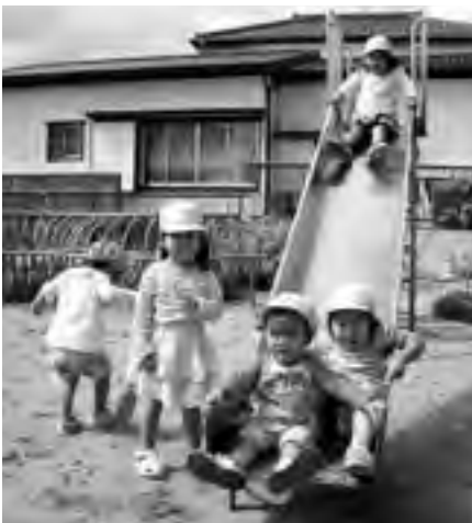
将来を担う子どもたちや高齢者が安心して生活できる教育・福祉の充実『夢を育む人にやさしいまちづくり事業』

「ふるさと御宿」を愛する方々から寄附を通じて支援を受け、まちづくりの担い手となっていただく「活力あるふるさとづくり基金」。今年度も6ヶ月が経過し、様々の方からご賛同をいただきましたので、その状況をお知らせします。また、お寄せいただいた寄附金については寄附者の意向が十分反映されるよう特色ある地域づくりに役立たせていただきます。