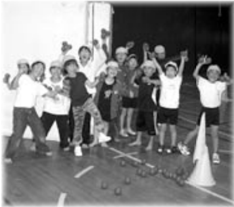
放課後の時間を活用したRAC (B&G)

平成19年度から2ヶ年で行っていた御宿小学校の耐震改修が終了し、児童が安全に学べる環境を整えた他、給食用食器の買い替え等を行い、安心して給食が食べられるよう、衛生面での向上にも努めました。 また、姉妹都市との交流や国際化へ向けての外国人講師による授業などを行い、幅広い分野での学習ができるよう努めました。 その他、B & G 海洋センターでのRACや、公民館での放課後子ども教室を行い、学校以外でも地域の方々と接しながら、より多くのことを学べる環境を作りました。