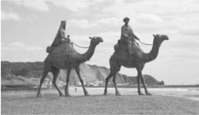
環境の保全・街並み整備など魅力ある景観づくり 『幻想の世界「月の沙漠の旅」づくり事業』