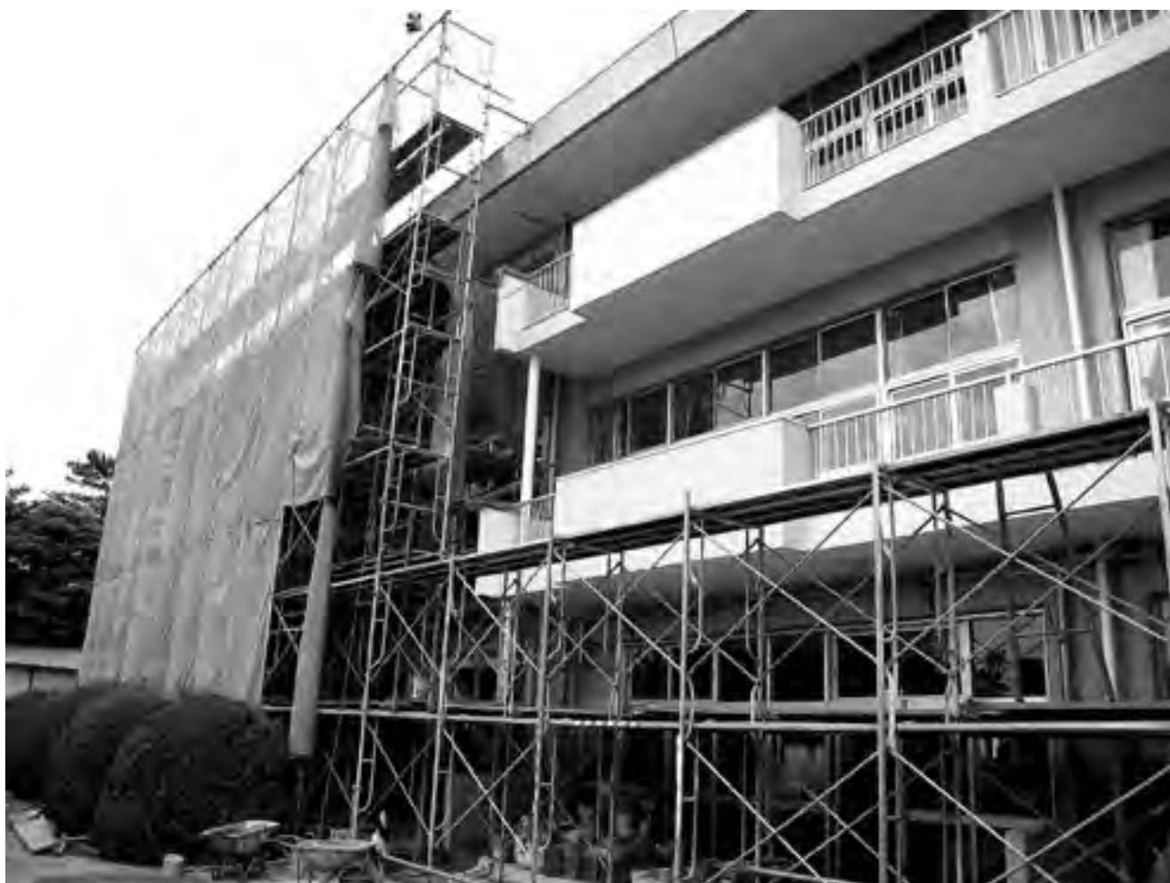
御宿小学校の耐震補強を行い、児童が安心して学べる環境を整えました。

決算は、実施した施策の投資効果等について様々な視点から評価することにより、次年度以降の行政運営に活かしていくものです。平成 20 年度の行政運営について皆さんの評価を幅広く伺い、今後のまちづくりに様々な分野で役立てていきたいと考えております。