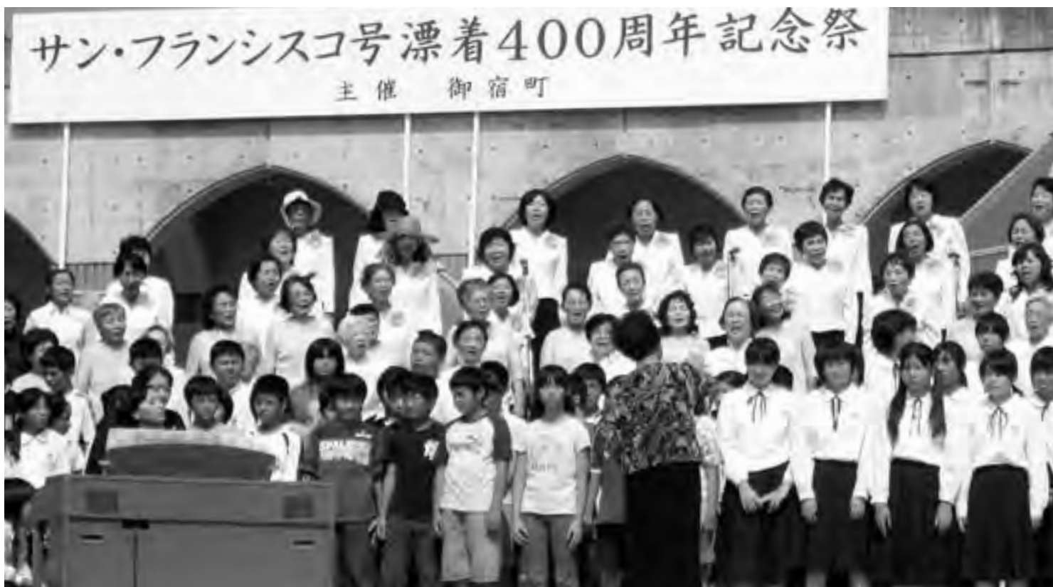
小学生・中学生・コーラス愛好会等による 400 周年記念創作歌曲「あの日を忘れない」