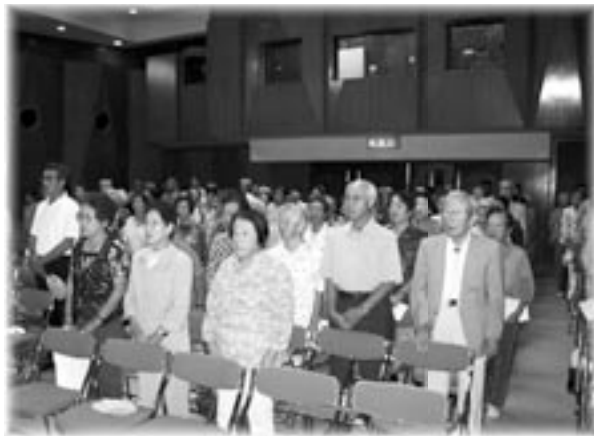
老人クラブの活動を支援

高齢者が安心して暮らせるよう緊急通報装置の設置を進めた他、健康維持や社会参加の促進に向け、老人クラブへの様々な支援を行いました。また、妊婦検診の公費負担拡充や小学生への入院医療費助成の開始、さらには、子育て支援拠点事業として児童館事業の拡大を行い、少子化対策に取り組みました。その他、ごみ処理施設運営の適正管理や、環境整備員による清掃活動を行い、きれいな町へ向けての政策を進めました。