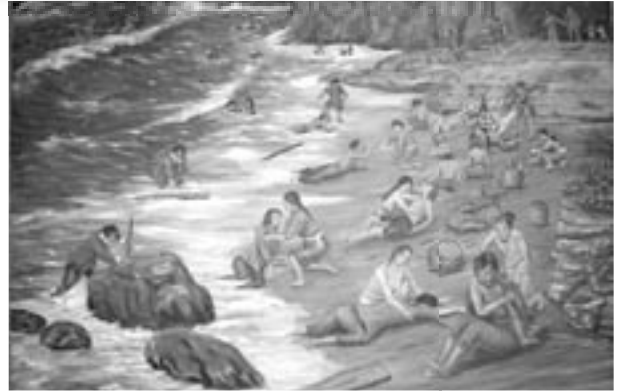
400年前の人類愛溢れる海難救助劇を幅広く伝承 『世界に発信「人類愛の輪」事業』