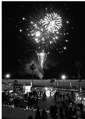
▲イベント最後の花火

イベントの最後には、花火が打ち上げられ、参加者のみんなが楽しめる催しとなりました。