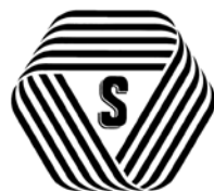
厚生労働大臣認可