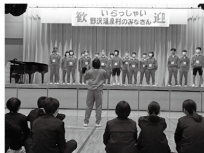
▲みんなで「虹」を合唱