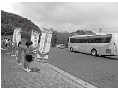
▲野沢温泉中学生をお出迎え

野沢温泉村中学校の生徒は「みんなと実際に会って交流できないと思っていたので、交流できてよかった。合唱はとても感動しました。」と話し、御宿中学校生徒からは「実際に会えて嬉しかった。またいつか交流できる日を楽しみにしています。」と話していました。