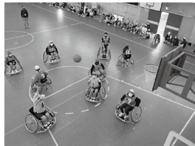
▲ミニゲームスタート!