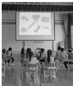
▲「栄養のバランス」について学習中

御宿町食生活改善会と町の主催でおんじゅく認定こども園の5歳児を対象とした食育講習会「チャレンジ! クッキング」を行いました。