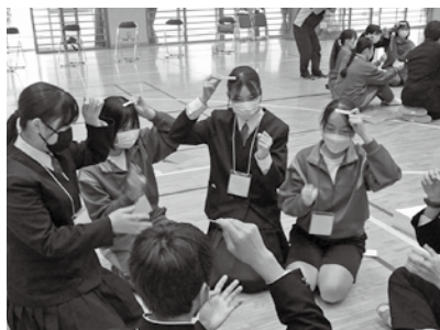
▲レクリエーションで自己紹介