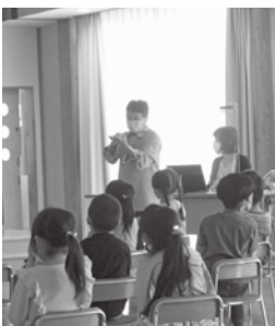
▲「てあらいのうた」を歌いました