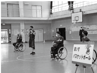
▲選手から競技紹介

選手からは「障がい者の人やスポーツが苦手な人でも、ルールを工夫すれば一緒にスポーツを楽しむことができます。様々な障害を知ってもらいたい。」とお話がありました。