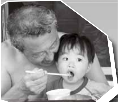
おじいちゃんと一緒にかき氷冷たかったかな?