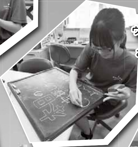
ウォーターパークのイベントをお客様にお知らせ

各種イベントは多くの観光客で賑わい、特にプールは昨年よりも1,000人近く多い来客数となりました。