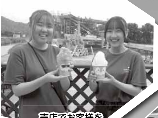
売店でお客を笑顔でおもてなし

今年の夏はプールと海水浴場の開設をはじめ、ビーチバレー・ムーンカップやビーチサッカー大会など様々なビーチイベントが開催されました。