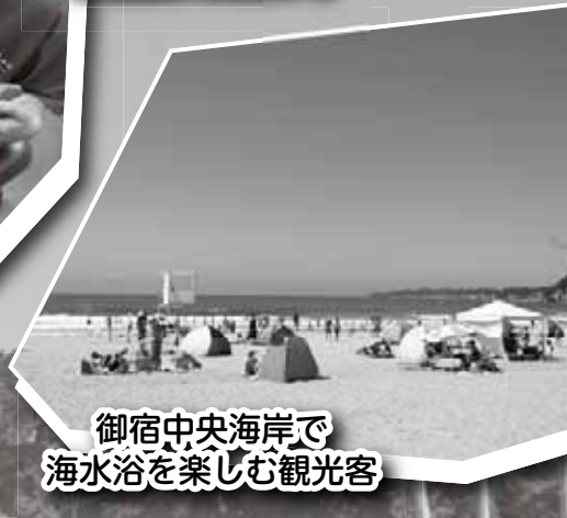
御宿中央海岸で海水浴を楽しむ観光客