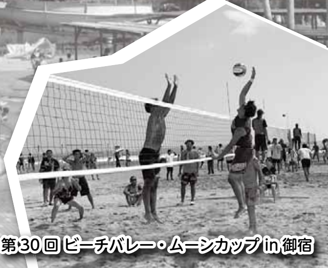
第30回 ビーチバレー・ムーンカップ in 御宿