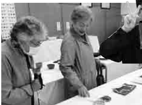
▲陶芸教室では、小さな作家さんがお客さんをご案内