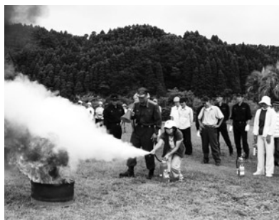
▲自主防災訓練（御宿台区）

A 有事の際には各事業者、海岸売店等などの簡易トイレを借りるなど、町内の保有数を確認し、使用計画的なものがないものか調査検討をしたいと思えます。仮設トイレ等については、合併症を併発することも考えられ重要な施設であります。今後、町内に所有する会社があるか確認し、協定ができればと考えます。