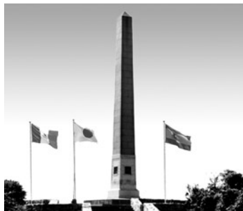
▲日西墨三国交通発祥記念碑 (メキシコ記念塔)

えます。来年度につきましては、日西墨交流四百周年記念の山場を迎える年となり、メキシコ大統領の来町につきましても、外務省を通じ具体的に調整が進められています。皆様のご協力をいただきながら、地域のあらゆる力を結集させて事業を成功させたいと考えています。