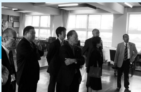
▲教育民生委員会学校訪問（御宿小学校）