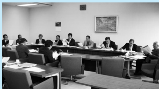
▲議員視察会議風景写真（草津町役場にて）

御宿町においても健康福祉や少子高齢化対策等は喫緊の課題であり当議会においても積極的に情報を収集し、より良い地域づくりに向けて努力してまいります。