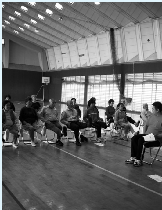
▲介護予防『鶴亀教室』