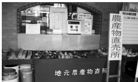
▲農産物直売コーナー(月の沙漠記念館)