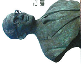
こよなく愛した奥の海を見つめる、加藤まさをの胸像。