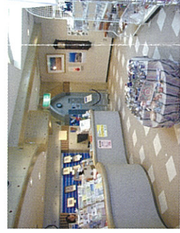
A ミュージアムショップ ポストカードや加藤まさを詩画集など、月の沙漠や御宿の海岸をテーマにしたさまざまなおみやげグッズが取り揃えてあります。