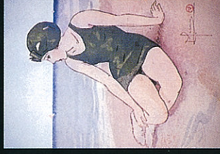
小説集「速い瀧蔵」挿画 夏を待つ人