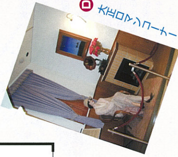
D 大正ロマンコーナー