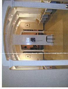
E 加藤まさを展示室 加藤まさをの詩の朗読を聞ける受話器なども設置されています。