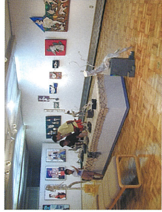
B 企画展示室 当地ゆかりの文化人の作品展示を行っています。

また、二階には、月の沙漠記念館の原型作品を展示した「ラウンジ・ギャラリー」も配置されています。