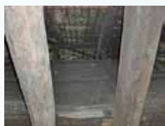
母屋の梁「サン・フランシスコ号の帆柱」と言われています