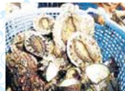
あわびの水揚げの様子

※御宿町の千葉ブランド水産物認定品は「外房あわび」「外房イセエビ」「外房つりきんめ鯛」です