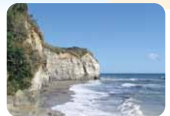
ドン・ロドリゴ上陸地 田尻海岸