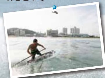
Eugene Teal

白い砂浜と青い海…本物の海を満喫してください。 サーフィン体験、釣り等。 ぼ〜っと眺めてリフレッシュ。 海の幸も豊富です。 ぜひ、揚げりたての 鮮度抜群の海の幸を 召し上げれ！