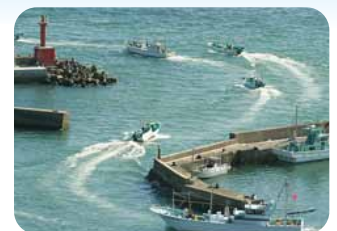
イセエビ網漁出船風景

距離 約10km 時間 約2.5~3時間 川沿いから海岸線を行き、途中からの急勾配を登ると広大な太平洋を一望できます。 景観の素晴らしいコースとなっています。