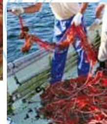
イセエビの水揚げの様子

イセエビは千葉県が北限とされ、広大な器械(きかい)根(ね)と隣接する磯根を漁場とし、エサが豊富で、夜明け前に網揚げを行い、一尾ずつ丁寧に扱い、活力の低下を防いでいます。